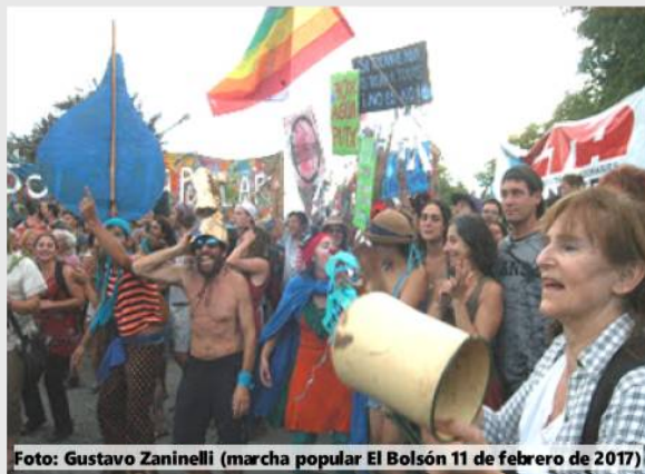
(marcha popular El Bolsón 11 de febrero de 2017)

nuestros cuerpos son víctimas de estas políticas de propiedad privada, de modelos prearmados que sólo sirven a intereses mezquinos, normalizadores, homogeneizantes.