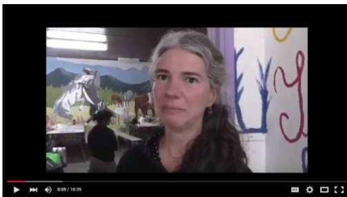
Talleres descentralizados C.E.A

Los y las invitamos a compartir este mini documental que muestra desde los sentires de la gente la necesidad de que estas experiencias sigan teniendo lugar en nuestros parajes rurales: