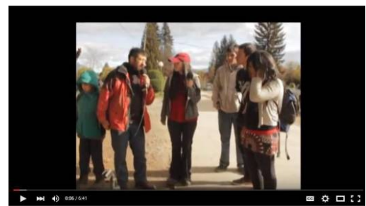
Jornada artística por la desnaturalización de la violencia institucional

desde la gente se construye una necesaria mirada alternativa, que cuide a los y las pibas de la violencia institucional. Los y las invitamos a ver el informe: