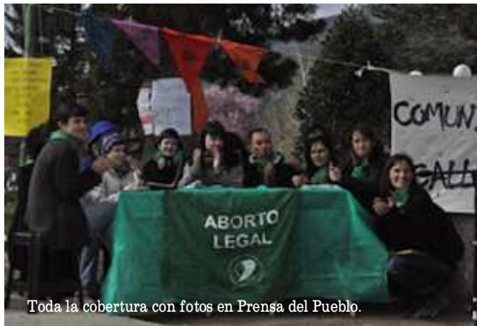
Toda la cobertura con fotos en Prensa del Pueblo.

Participaron como invitados e invitadas: trabajadores/as de la salud; estudiantes de escuelas secundarias N° 788 de Lago Puelo, CEM 48 de El Bolsón y CET 23 de Mallín Ahogado; socorristas En Red de El Bolsón; entre otros, además hubo música en vivo.